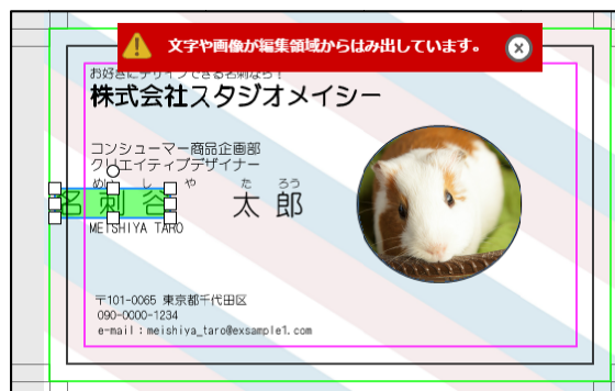
はみ出し・重なり等を未然に防ぐエラー検出機能搭載