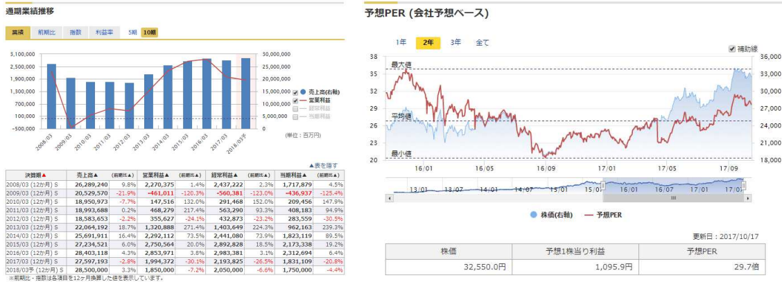
《「マネックス銘柄スカウター」画面イメージ①：長期間の業績や株価指標》

最長10年間の企業業績（売上高、営業利益、経常利益、当期純利益など）や最長5年間の各種株価指標（PER、PBR、配当利回りなど）をグラフで表示します。長期間の推移を視覚的に確認できるため企業の成長性やバリュエーションを判断する際に便利です。