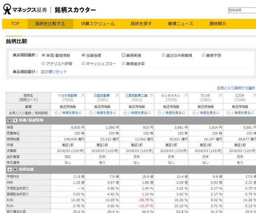
《「マネックス銘柄スカウター」画面イメージ②：表形式の銘柄比較》

選択した銘柄の時価総額や株価指標、業績推移やアナリスト評価など、株式投資に役立つ情報を表形式で一覧表示します。様々な指標を一度に比較検討できるため、同じ業界内での各銘柄の割高・割安の判断を短時間で行うことができます。